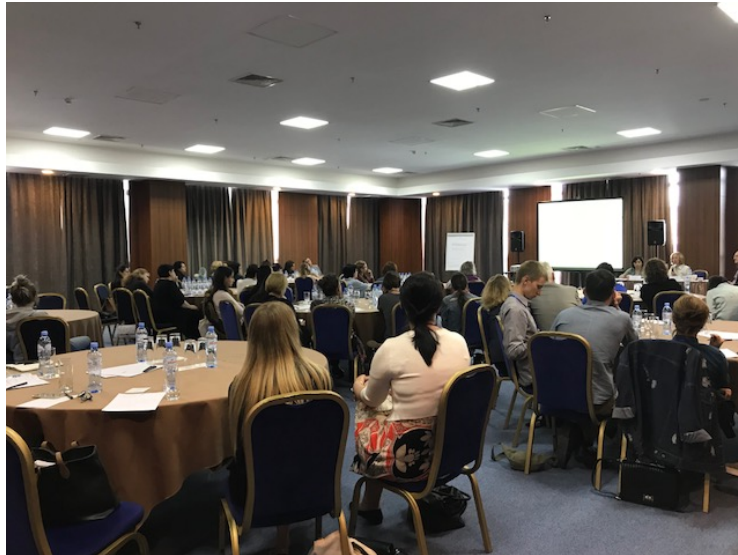
En un simposio acerca de las intervenciones basadas en la CIF

Se trató de forma intensa el cambio de forma de pensar en cuanto a la discapacidad infantil, siendo la necesidad de trabajar por la participación de los niños el take-home message (mensaje final) de gran parte de las intervenciones realizadas. Cabe destacar que tanto la EACD como el comité organizador local de Tbisili hicieron un gran trabajo a la hora de llevar a cabo sesiones de temáticas transversales relacionadas, por ejemplo, con los programas educativos que la Alianza Internacional de Academias de la Discapacidad Infantil está desarrollando en la actualidad o las estrategias a considerar para publicar investigaciones clínicas en revistas de impacto, entre otras.